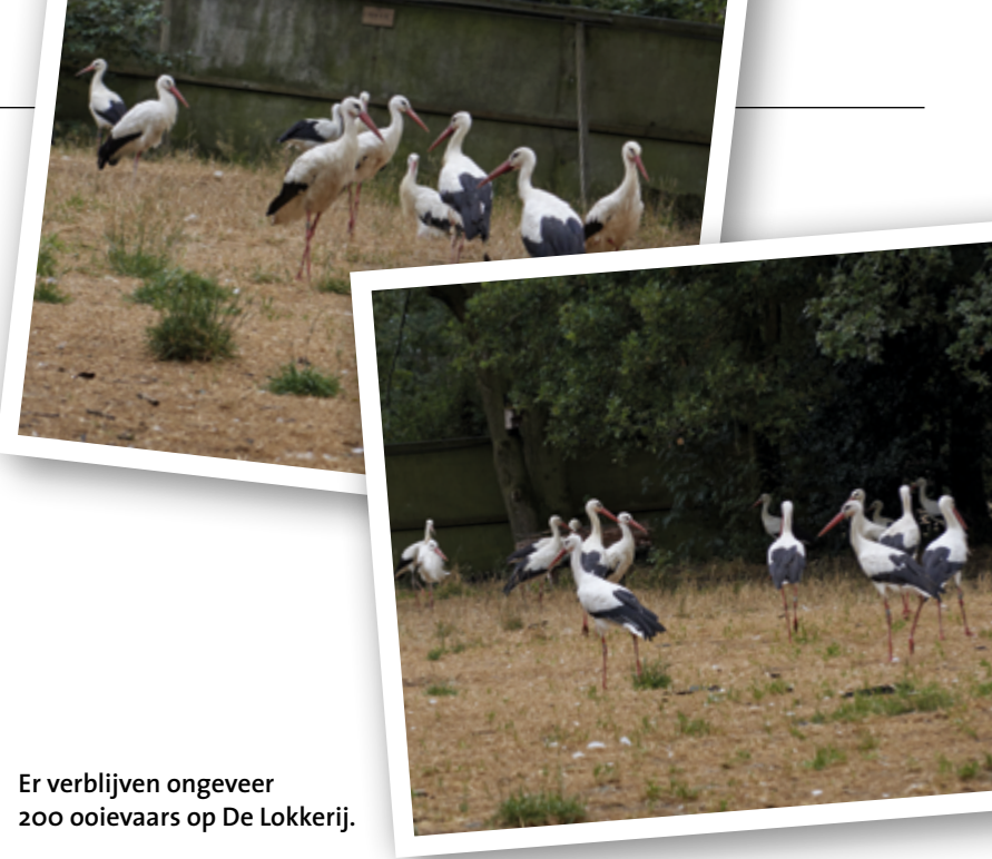
Er verblijven ongeveer 200 ooievaars op De Lokkerij.