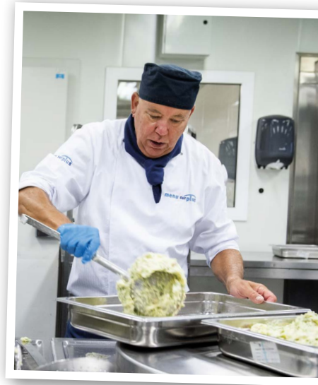
Wekelijks produceert Menu Surplus meer dan 10.000 maaltijden.

in de begeleiding. Als hier iemand 80 of 120 uur over de vloer komt, is het voor iedereen beter als hij of zij het een beetje naar zijn zin heeft. Ik heb de werkstraf daarom altijd benaderd