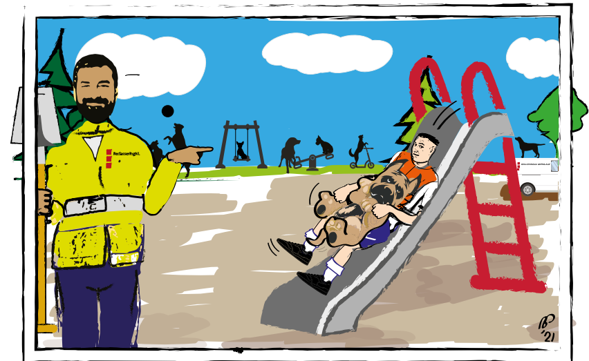
DE WERKSTRAF: SOMS IS HET LETTERLIJK EEN HONDEN(GLIJ)BAAN

portaal. Ook geeft de kaart antwoord op veel gestelde vragen als: ik ben vergeten een werkgestrafte uit te checken, wat nu? Wat moet ik doen als een werkgestrafte niet komt opdagen? Wat als ik per ongeluk de verkeerde werkgestrafte heb ingecheckt? Staat uw vraag niet op de kaart of heeft u toch problemen met inloggen met MFA? Geen nood! U kunt ook contact opnemen via servicedesk@reclassering.nl . Zij zullen u mail vervolgens zo snel mogelijk beantwoorden.