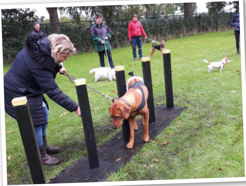
In Beilen ligt de grootste hondenspeeltuin van Europa.

te lossen, klopte Hatzmann in 2018 bij Reclassering Nederland aan voor een samenwerking. De stichting werkt inmiddels samen met de reclassering in Assen, Leeuwarden, Veenhuizen en Almelo.