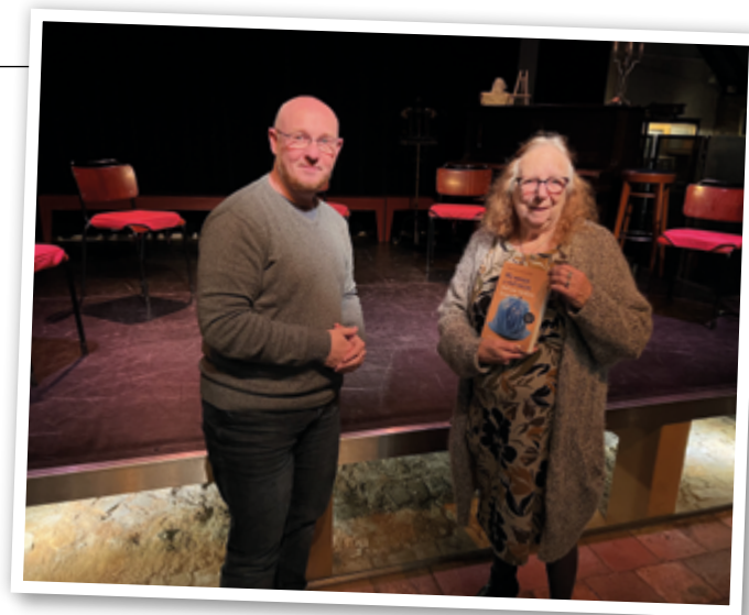
De gelukkige winnares

Nellie zag veel werkgestraften met een positief gevoel weggaan. “Voor mij is de werkstraf ook iets positiefs. Ik hoop dat ik mensen wat mee kan geven en meestal lukt dat ook. Zoals bij die Marokkaanse jongen die tijdens de lunch alleen maar bezig was met het ophemelen van Marokko en