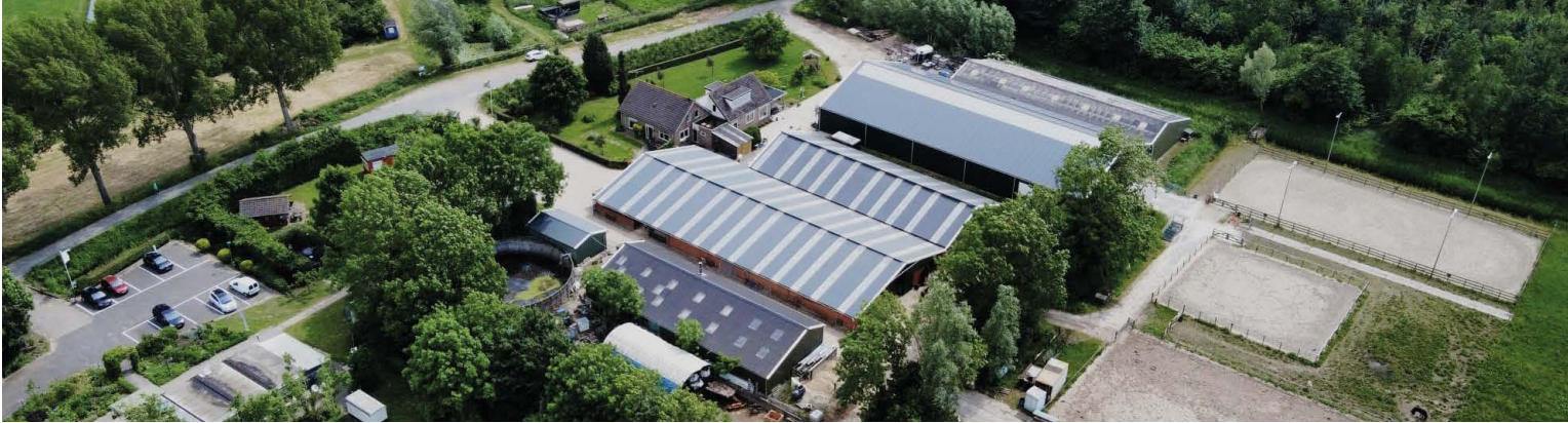
De Kooise Zorgboerderij/ camping biedt ieder jaar plek aan zo'n 50 werkgestraften.